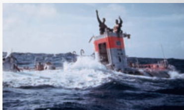
Record de plongée dans la Fosse des Mariannes en 1960 par Jacques Piccard et Don Walsh.